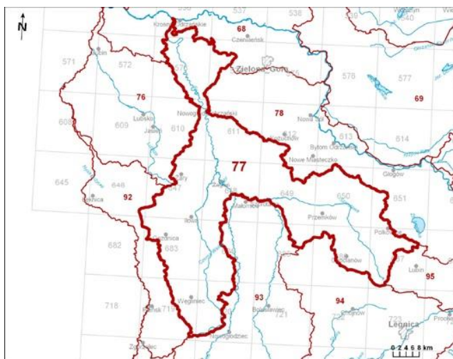
Rycina 1: Lokalizacja JCWPd nr 77.