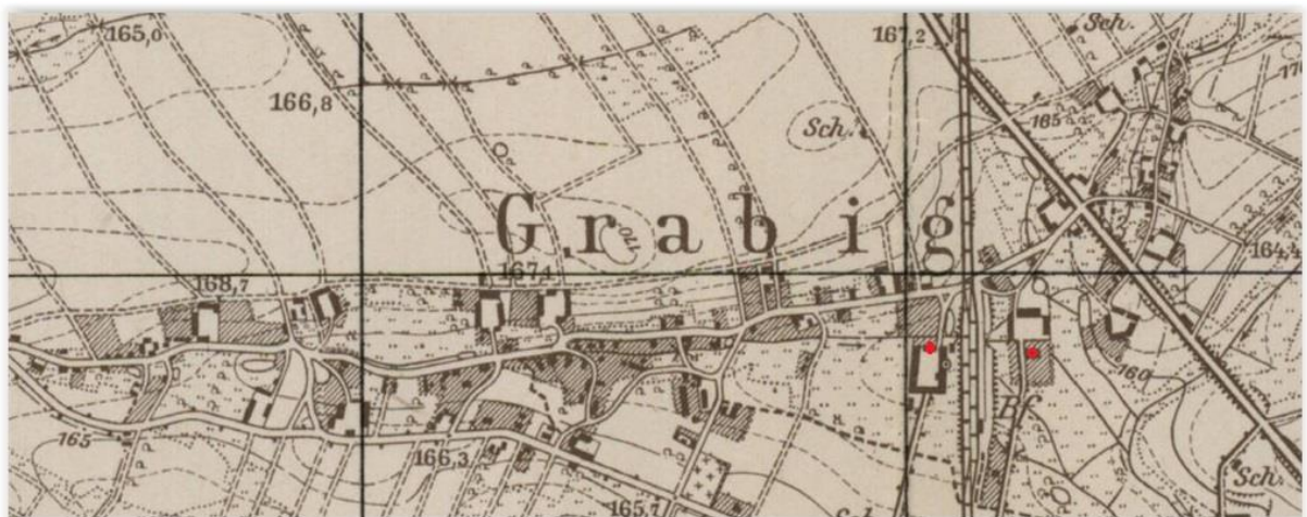
Ryc. 1 Historyczna rycina Grabika