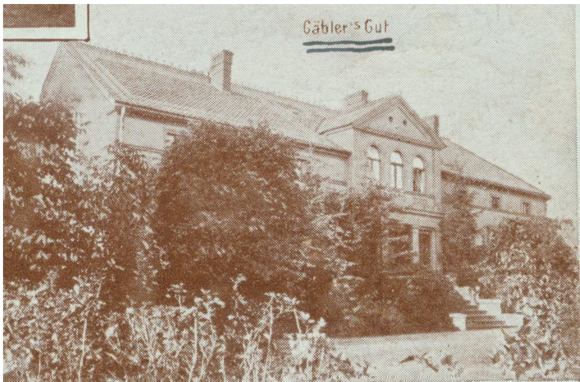
Ryc. 2 Dwór Gaeblera http://zamkilubuskie.pl/grabik-grabig/

Drugie założenie dworskie powstało w 2 połowie XIX wieku. Na początku XX wieku należało do rodziny Pusch. Położone jest w obrębie założenia folwarcznego oraz parku. Obecnie w rękach prywatnych.