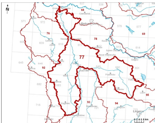
Rycina 1: Lokalizacja JCWPd nr 77.